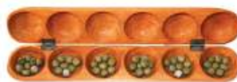
Awalé - Jeu Africain