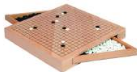
Jeu de Go - Jeu Chinois

Pour y participer, réservation auprès de la Communauté de Communes Picardie des Châteaux au 03 23 80 18 13.